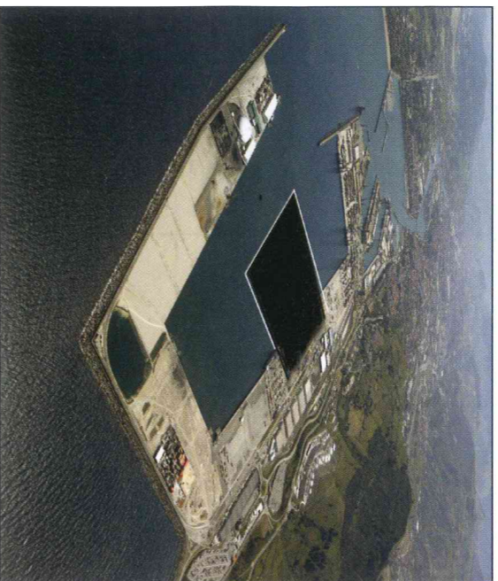
Simulación del nuevo Espigón Central

El proyecto del Espigón Central de la Ampliación del Puerto de Bilbao, en el Abra Exterior, dispone de su propia resolución individualizada de Declaración de Impacto Ambiental (DIA) y constituye el principal destinatario de las arenas extraídas, objeto del otro proyecto. Permitirá la generación de tres nuevas líneas de atraque: el muelle A5 de 700 metros de longitud y los muelles A4 y A6, con 650 metros lineales de longitud cada uno, lo que hace un total